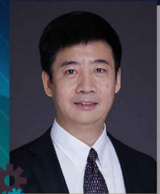
主講嘉賓 小米集團副總裁兼 集團技術委員會主席 崔實秋博士

MIT人工智能研究和應用的簡介與啟發 A Glance of AI Research and Applications at MIT